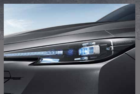
Feux full led