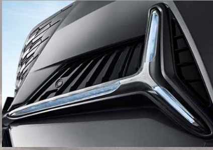
Signature emblématique CHANGAN