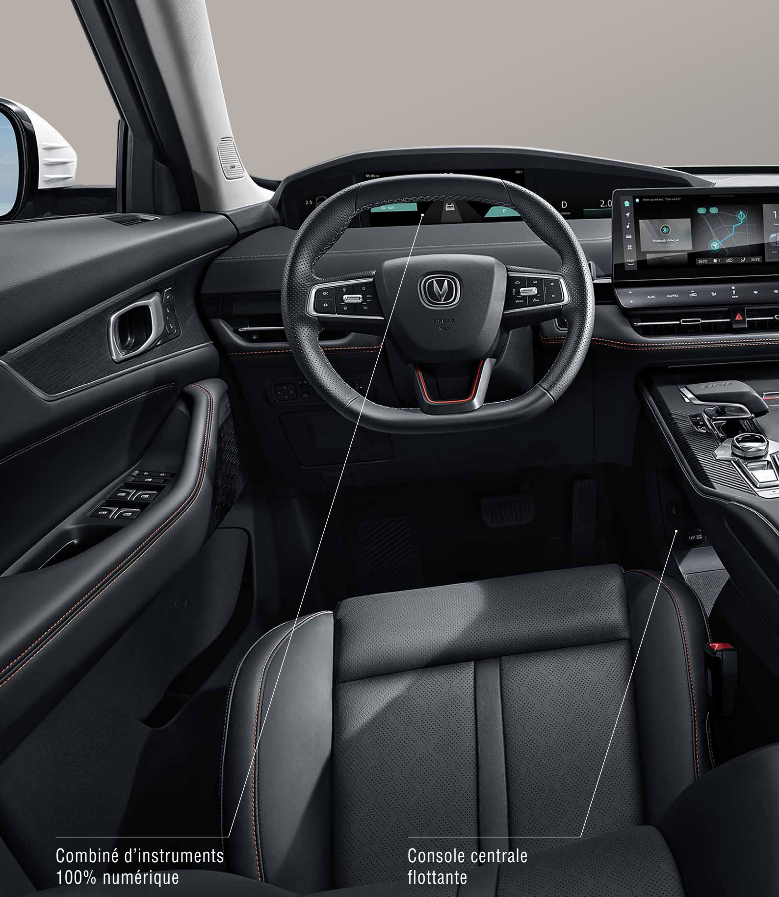
Combiné d'instruments 100% numérique