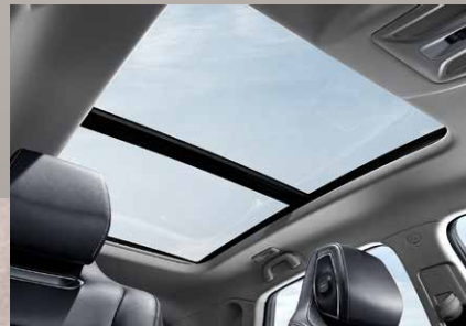
Toit ouvrant panoramique