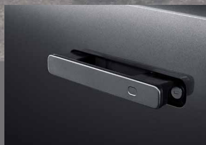
Poignets de portes affleurantes